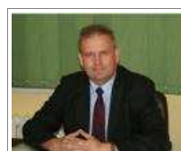
Zdjęcia dostarczone przez osoby zainteresowane lub zrobione prywatnie przez redakcję.